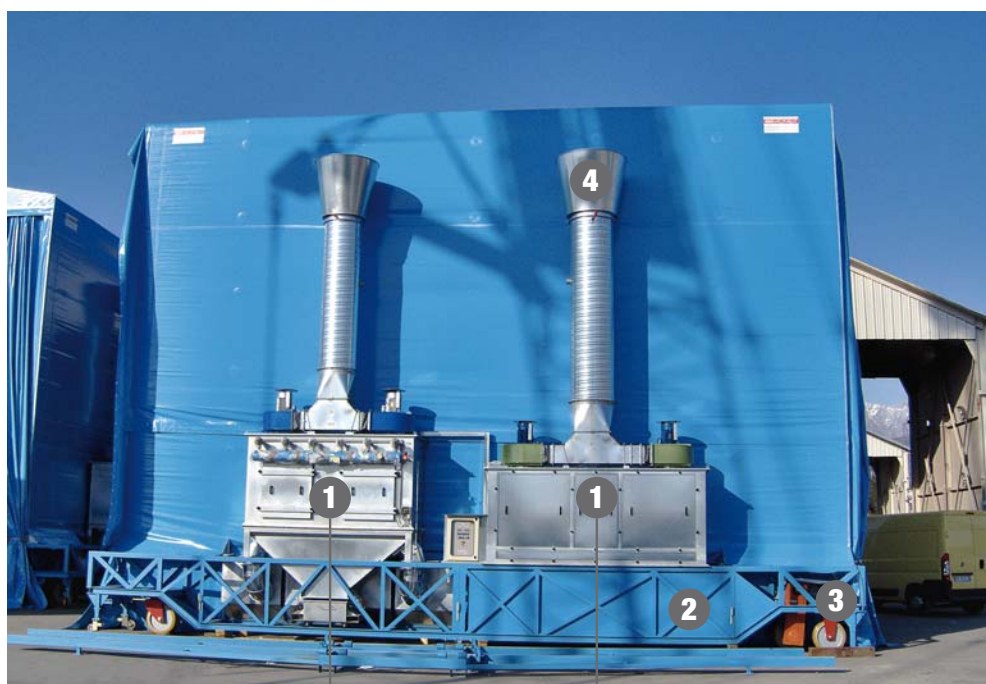
Filtro per fase sabbaiatura

6 Sistema pulizia in contro lavaggio automatico su filtrazione sabbaiatura