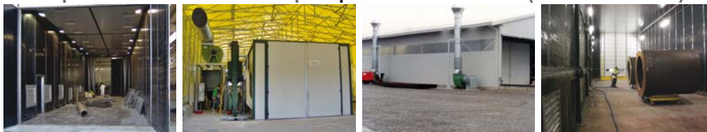
Collocazione interno fabbricato con tramoggia di carico fuori pavimento (a pala)