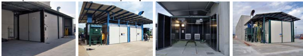
Collocazione esterno fabbricato con tramoggia di carico fuori pavimento