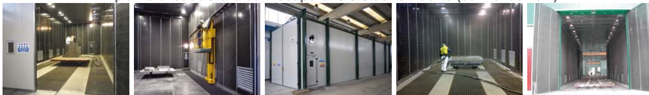
Collocazione interno fabbricato con raschiatori e coclea