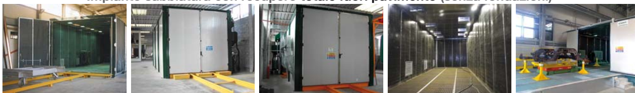
Collocazione interno fabbricato con basamento e binario